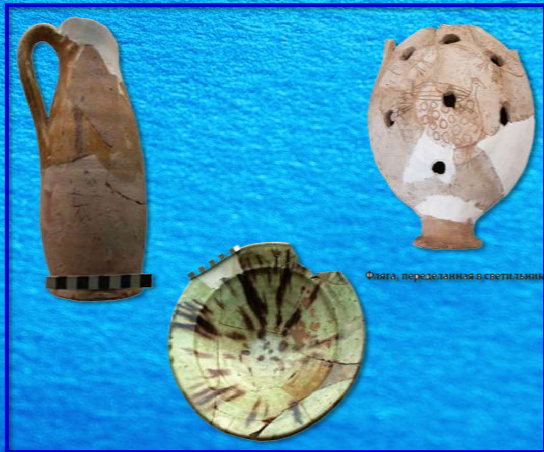
Фляга, переделанная в светильник