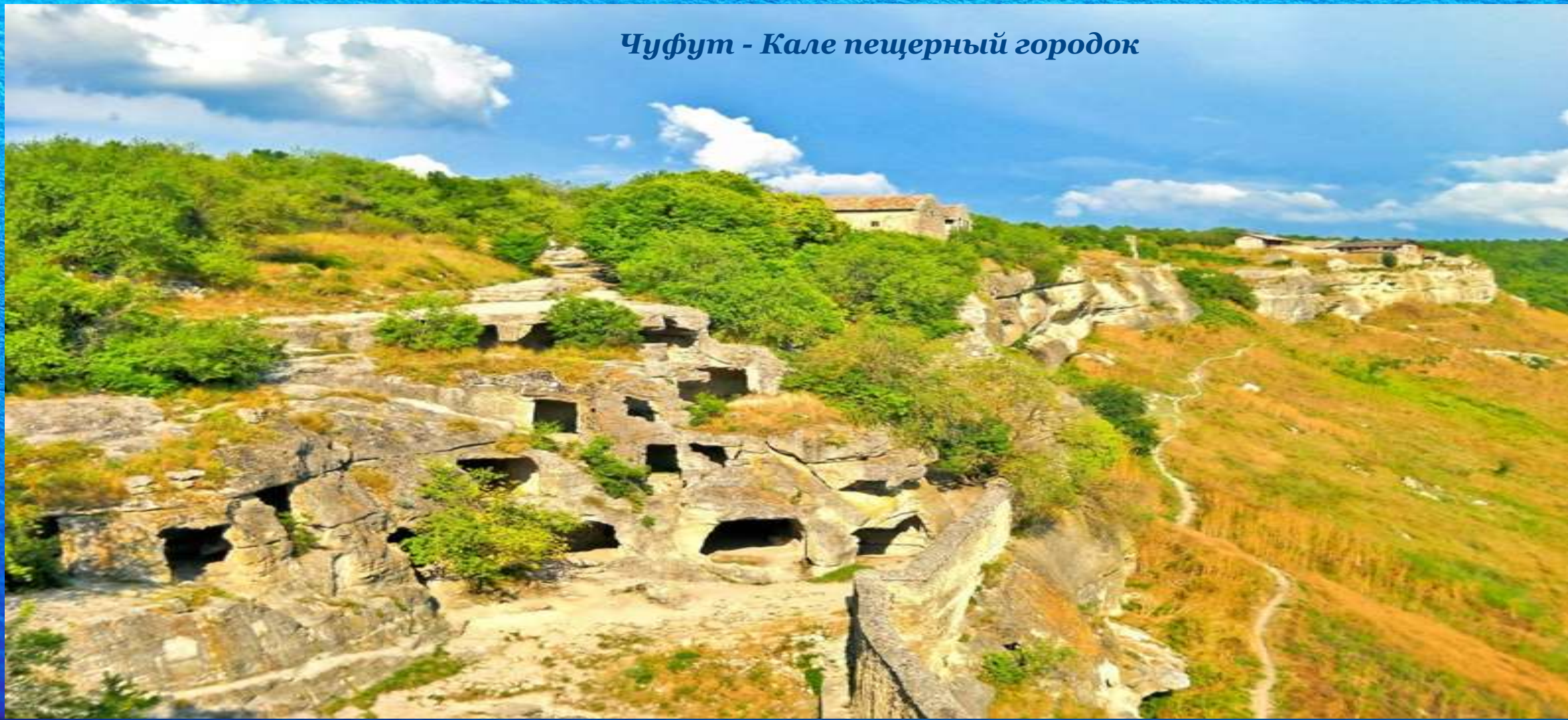
Чуфут - Кале пещерный городок