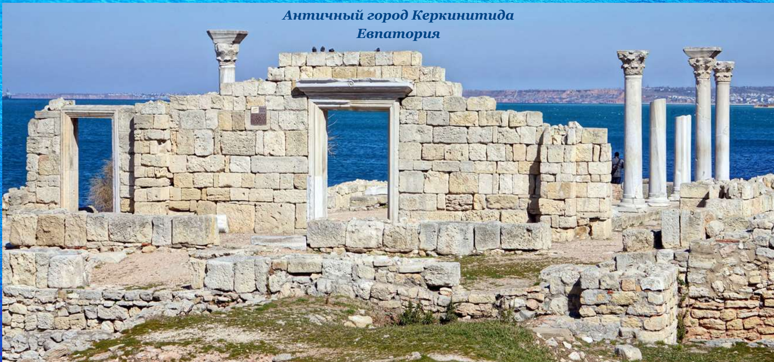
Античный город Керкинитида Евпатория

Керкинитида – город-курорт Евпатория, известный своими лечебными грязями, морскими минеральными водами.