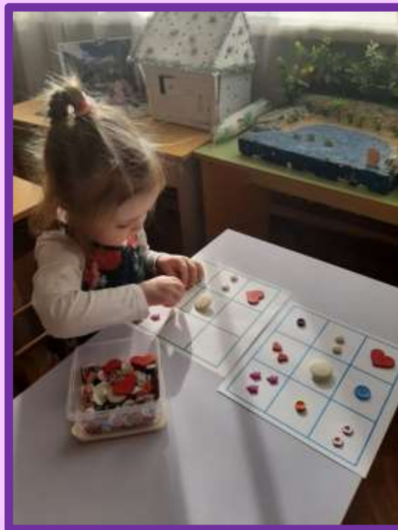
«Запомни и повтори»